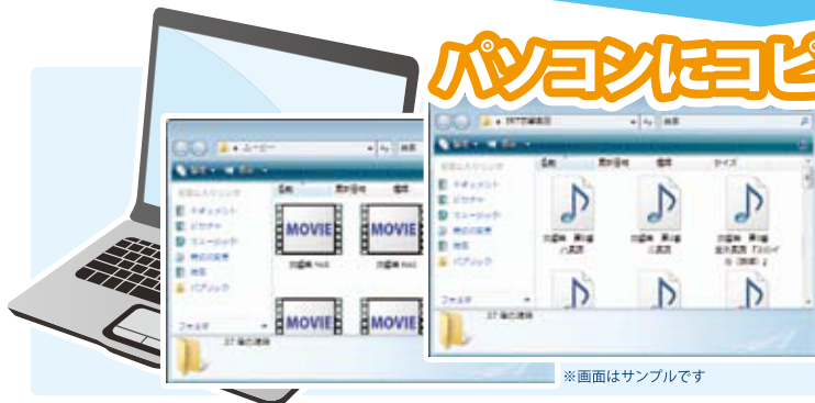
※画面はサンプルです